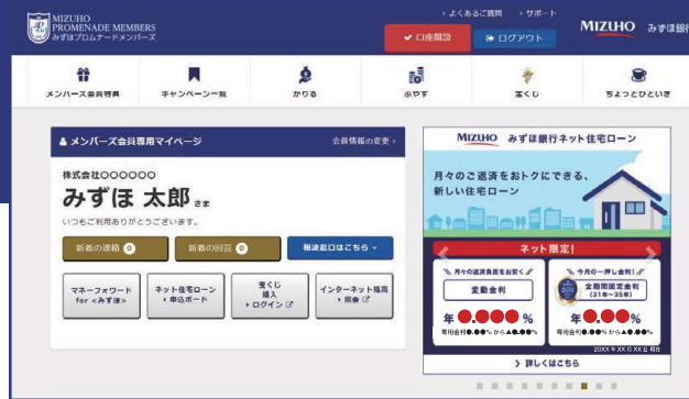
(ログイン後画面イメージ)